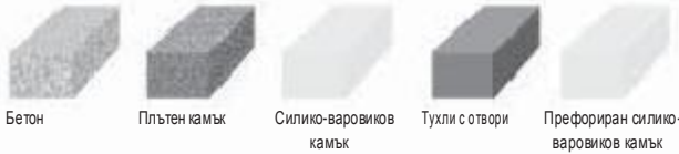
Бетон Плътен камък Силико-варовиков камък Тухли с отвори Префориран силико-варовиков камък