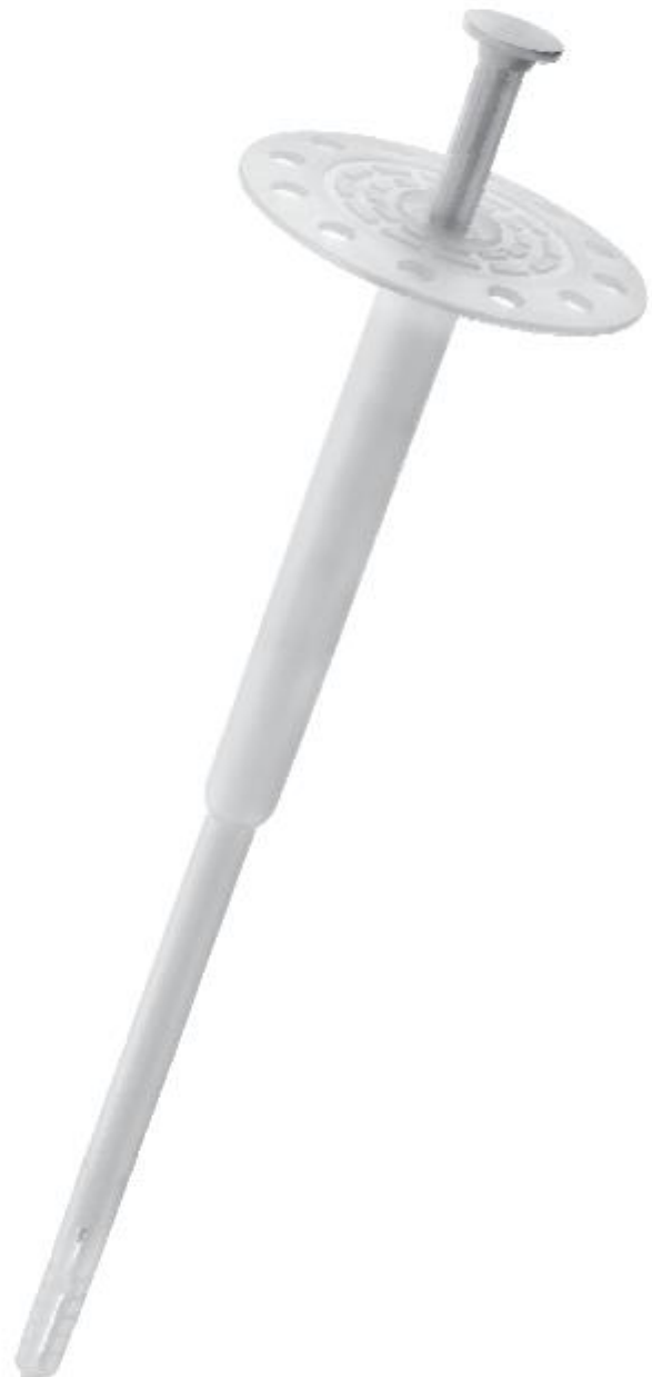
Опаковъчна единица: по 100 броя.